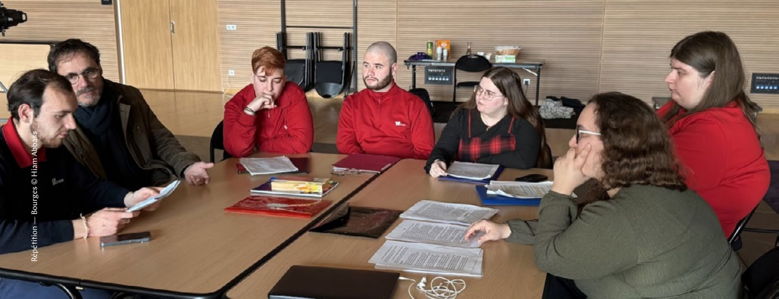
Répetition — Bourges