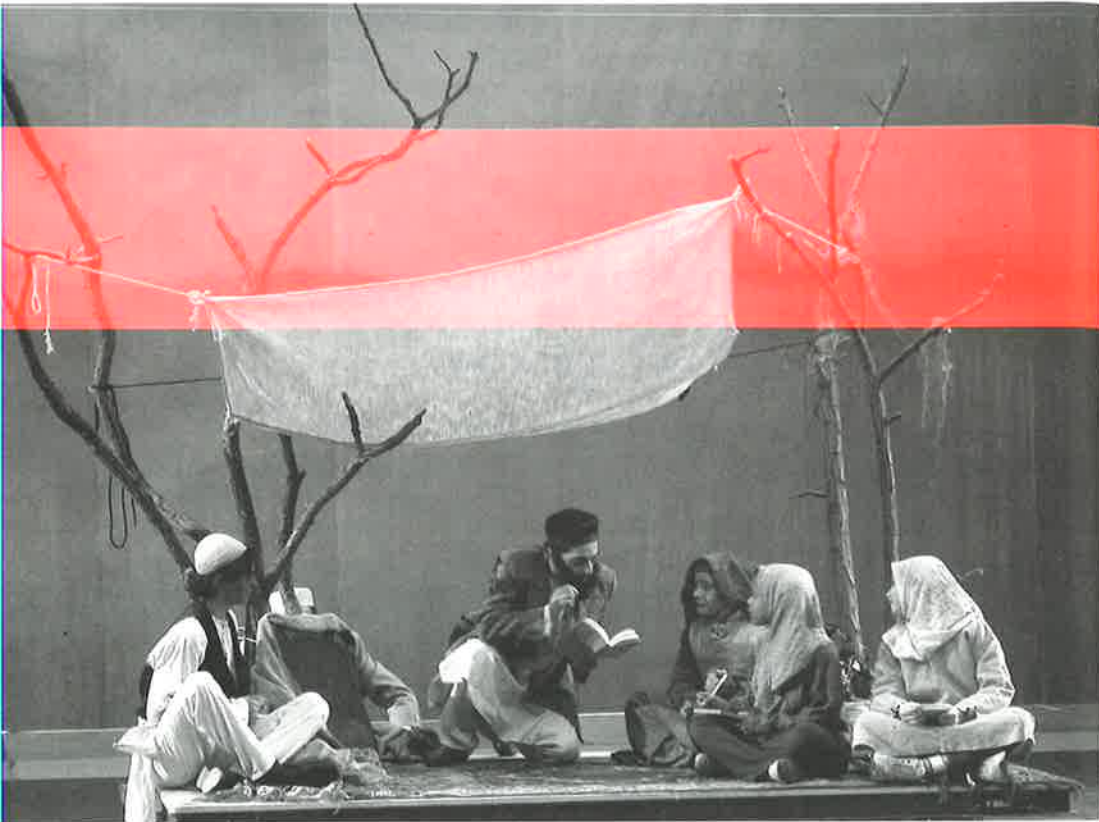
Le Dernier Caravansérail (Odyssees)